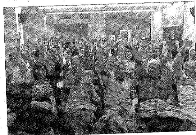
Els botiguers van rebutjar la proposta per unanimitat

sident de la FECES ha indicat que a Sitges tenim el sostre comercial cobert. L'entitat ha demanat d'entrevistar-se amb l'alcalde i els representants de les forces polítiques per conèixer el seu posicionament sobre el tema.